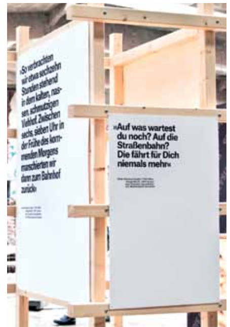
Ausstellung am Tag des offenen Denkmals

Für Anregungen und Kritik sind wir dankbar. Bitte nutzen Sie dafür die im FORENA-FORUM angegebenen Kontaktmöglichkeiten. Vielen Dank!