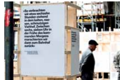
Besucher beim Gang durch die Ausstellung am Tag des offenen Denkmals