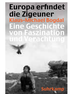
Das Buch zum Vortrag: Klaus-Michael Bogdal: Europa erfindet die Zigeuner - Eine Geschichte von Faszination und Verachtung, Suhrkamp 2013 Ausgezeichnet mit dem Leipziger Buchpreis zur Europäischen Verständigung 2013

e-mail: ADzeladini@dgb-bildungswerk-nrw.de