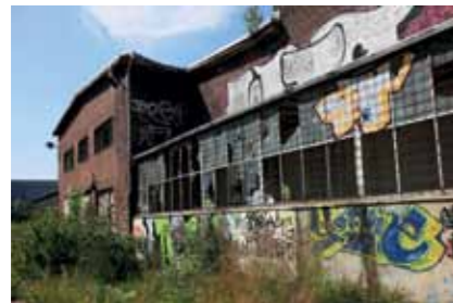
Der Eingang der alten Großviehhalle vor dem Beginn der Bauarbeiten (Aufnahme: 2008)

Fortsetzung von Seite 1: Bewegende Zitate einer Holocaust-Überlebenden kontrastierten dabei mit der kalten und bürokratischen Sprache, wie sie in den Dokumenten der Täter zum Ausdruck kommt. Die Gestaltung der Ausstellung erfolgte nicht zufällig in Anlehnung an den derzeitigen Zustand der alten Großviehhalle. Die stabilen, unbehandelten Holzgerüste symbolisierten zugleich den provisorischen Charakter der Ausstellung.