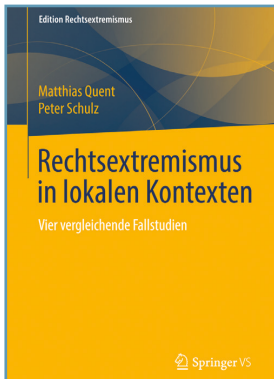
Wiesbaden: Springer VS Edition Rechtsextremismus 978-3-658-07369-5