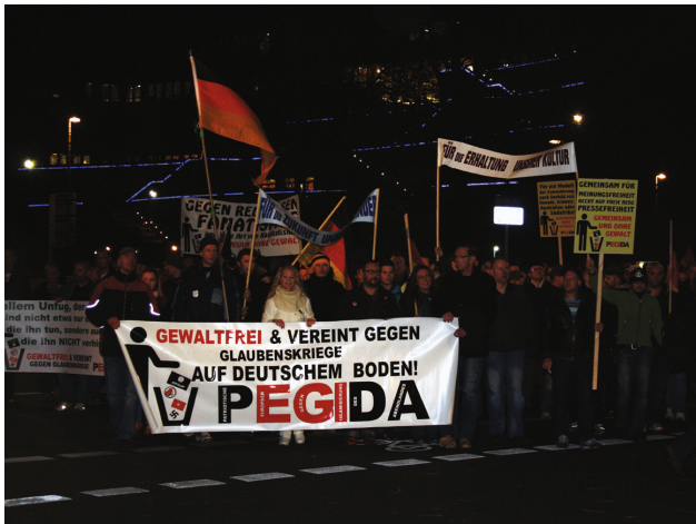
PEGIDA im November 2014.

7. Mit gezielten Falschinformationen und in hetzerischer Weise wird über das Internet Stimmung gegen Geflüchtete und die zivilgesellschaftlichen Akteur*innen der ›Willkommenskultur‹ gemacht. Zahlreiche Plattformen tragen zur Selbstbestätigung und als Mobilisierungsforen zur Zuspitzung der flüchtlingsfeindlichen und rassistischen Proteste bei.